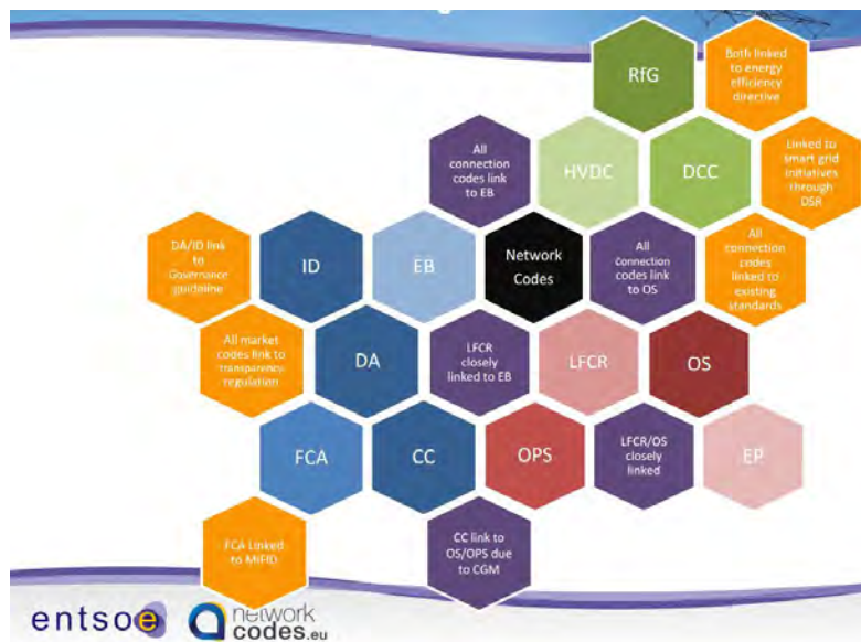
Figura 1. Estructura de los Códigos de Red de ENTSO-E.

Existe una coordinación directa entre algunos Códigos de Red, como lo muestra la figura 1: